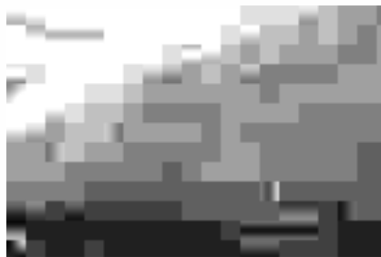
Lớp sơn mẫu (Test Patch) trên tàu hóa chất sau 61 tháng sử dụng trong môi trường nhiều Hà.