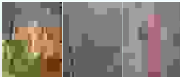
Hầm hàng bị rỉ nhanh chóng do sử dụng hệ sơn không thích hợp