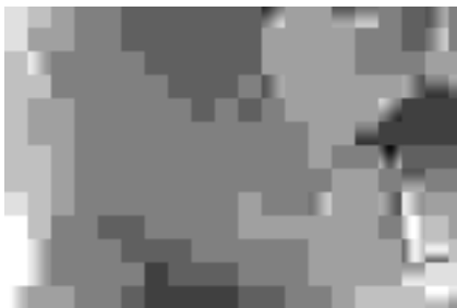
Sinh vật biển bám dưới vỏ tàu có thể làm tăng chi phí nhiên liệu